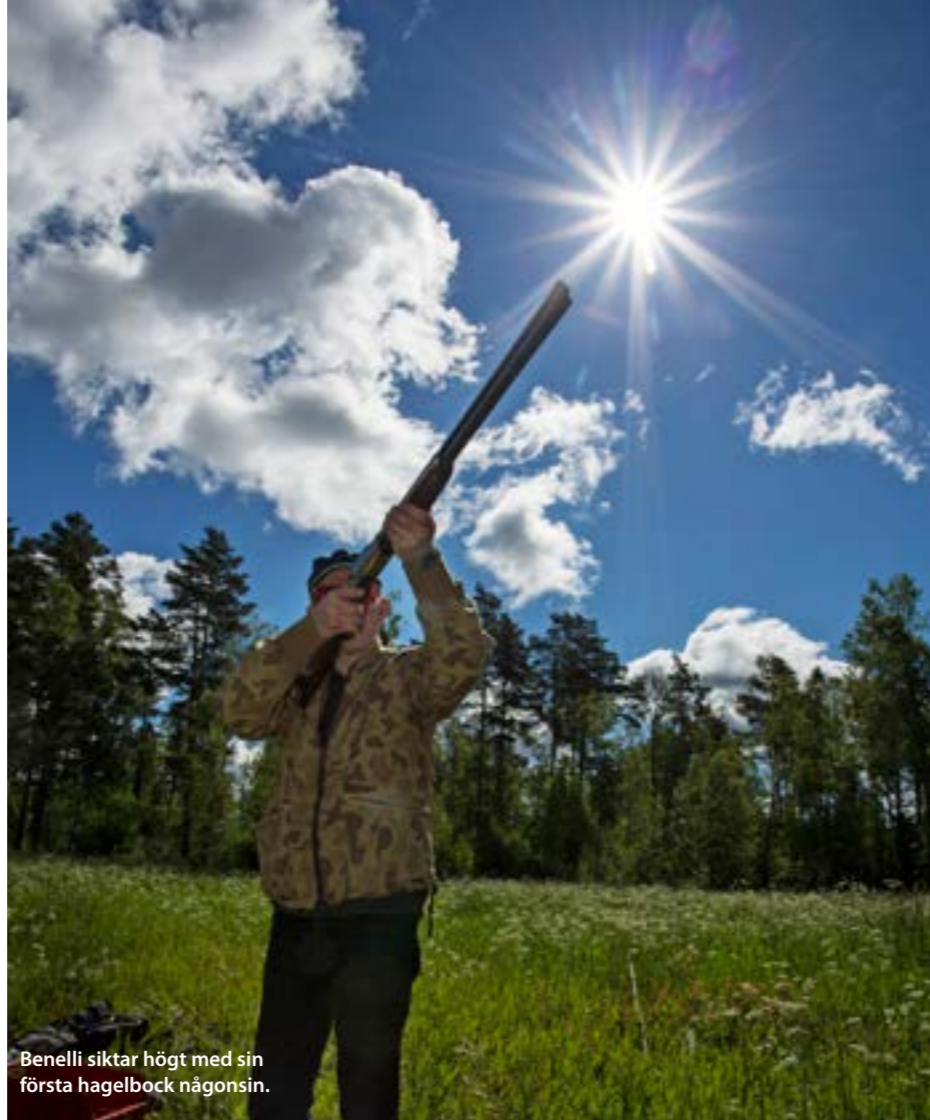
Benelli siktar högt med sin första hagelbock någonsin.

En något märklig brist tycker vi båda. För säkringsknappen strax under topplevern är ju ovanligt stor och väl ergonomiskt utformad. Varför inte passa på att göra en något högre topplever när man ändå var i gång?