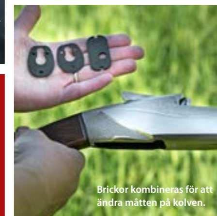
Brickor kombineras för att ändra mätten på kolven.