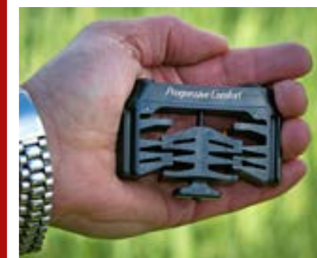
Det progressiva rekyldämpningssystemet Progressive Comfort ser ut så här när det plockats ut ur bakkappan.