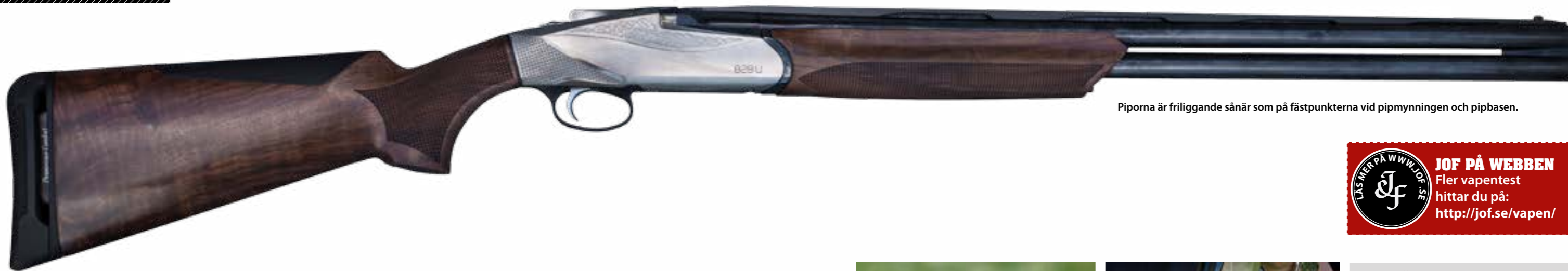
Piporna är friliggande sånär som på fästpunkterna vid pipmynningen och pipbasen.