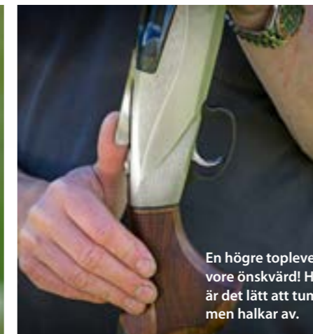
En högre toplever vore önskvärd! Här är det lätt att tummen halkar av.

RENT PRAKTISKT INNEBÄR det hela att baskylen på Benelli 828U därmed kunnat göras lägre. Detta ger i sin tur ett smidigare vapen med något lägre vikt. Baskylen är tillverkad av aluminium, något som också sänker bössans vikt. Spången är av samma skäl av kolfiber.