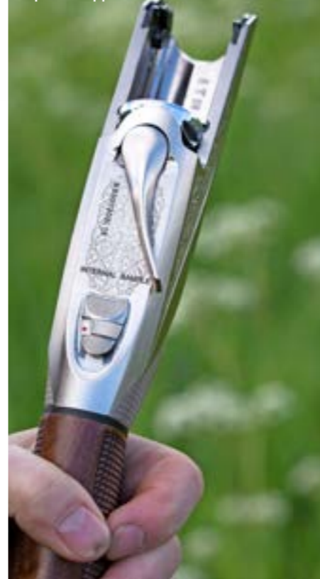
Topleverns läge då vapnet är öppnat.

vapnet öppnas. Då blir det med automatik trögt att öppna bössan, särskilt när den är ny.