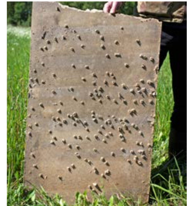
Bra träffbild på tavlan.

Sako Sweden är generalagent för Benelli i Sverige. En vapensmed som ansvarar för reparationer av märkets vapen finns på plats i Sverige. De flesta reklamationer torde därmed kunna åtgärdas här i landet och man slipper de långa väntetider som ofta är förknippade med att vapen måste skickas utomlands vid garantifel och andra reparationer.