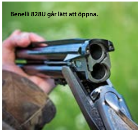
Benelli 828U går lätt att öppna.